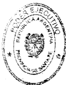
OMAR ÁNGEL PEROTTI GOBERNADOR DE LA PROVINCIA DE SANTA FE